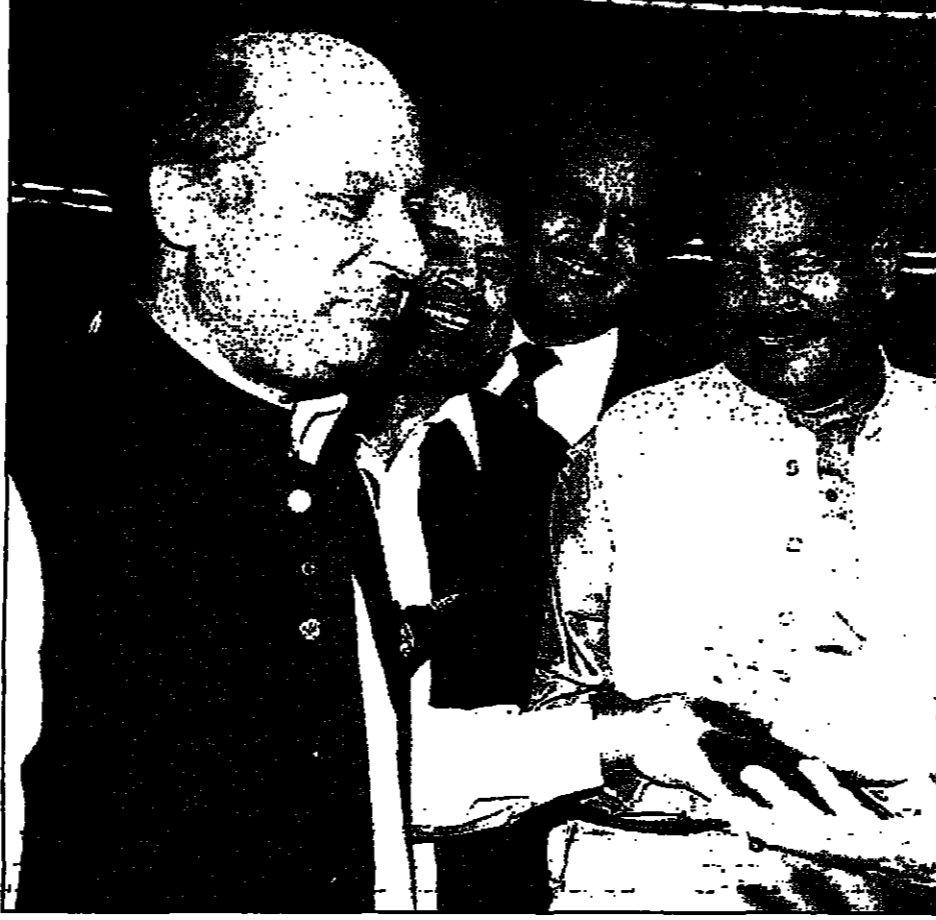
نواب في البرلمان الباكستاني يمشون رئيس الوزراء، نواز شريف، عقب اقراء مشروع قانون يحد من صلاحيات الرئيس

تايوان تجري تجارب على صاروخ «هوك». أعلنت تايوان أنها ستجري تجارب صاروخية باستخدام الصاروخ «هوك» في المستقبل القريب. تايوان تجري تجارب على صاروخ «هوك». أعلنت تايوان أنها ستجري تجارب صاروخية باستخدام الصاروخ «هوك» في المستقبل القريب.